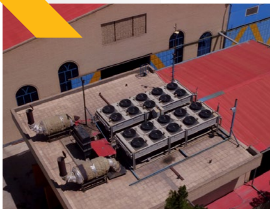
MOBIN ENERGY (4 MW)

PPA: Ministry of Power Owner: Mobin Energy Type: CHP-Continuous Natural Gas Developer: Banian Sanat Persian (BPS Co.) EPC: NNQ Energy Project Size: 4 MW