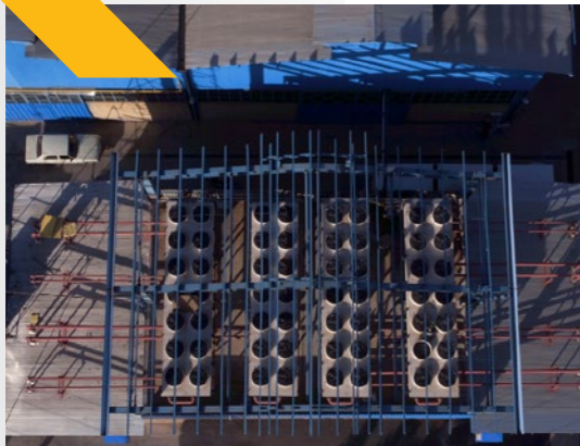
SOROUSH ENERGY (4 MW)

PPA: Ministry of Power Owner: Soroush Co. Type: DG-Continuous Natural Gas Developer: SGP Co. EPC: NNQ Energy/SGP Co. Project Size: 8 MW